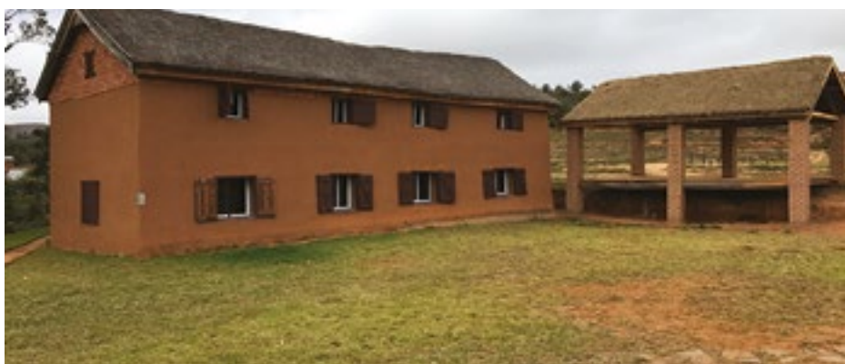
Le Musée des Deux Guerres, « Musée Johanesa Rafiliposaona », Tadio, Madagascar