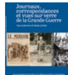
Livres Grande Guerre. Publication aux éditions des Falaises, Rouen Normandie.