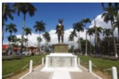
Le 9 octobre 2015, inauguration de la stèle de l'Avenue de l'Indépendance de Toamasina

malgache, du Ministère des Affaires étrangères malgache, du Ministère de l'Enseignement Supérieur et de la Recherche Scientifique malgache, du Ministère de l'Education Nationale malgache, du comité du centenaire de la Première Guerre mondiale à Madagascar, de l'Office National des Anciens Combattants, de l'Ambassade de France à Madagascar et en Macédoine, de l'Institut français de Macédoine, de l'Alliance française de Toamasina, de la mission du centenaire en France, de la Région Normandie, de la Région Atsinanana, de la Région Amoron'i Mania et de la Maison de la coopération à Toamasina, de nombreuses manifestations et actions voient le jour : colloques, séminaires, journées d'études, expositions, rédaction d'ouvrages.