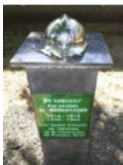
Monument aux morts par A. Zieba (lycée français de Tamatave)

aluminium d'Ampatolampy. Pour le deuxième ouvrage, les élèves ont travaillé sur l'analyse des journaux français, pendant la Grande Guerre, comme l'Illustration , dont la Une mettait en avant les tirailleurs malgaches. Ils ont eu à leur disposition des lettres et des cartes postales révélant la présence des soldats malgaches par exemple sur le Front de l'Orient. Enfin, les 1ères avaient comme source des vues stéréoscopiques que le Musée de Tadio venait de récupérer. Le troisième, ouvrage qui sera publié pour juin 2018, a comme objectif de nous faire connaître la dernière année de la Grande Guerre en France, dans le Front de l'Orient et à Madagascar. Les ouvrages diffusés, entre autre, dans des établissements malgaches ou dans les alliances françaises, permettent que l'histoire de ces 600 000 hommes et femmes venant de l'Empire colonial français et, parmi ceux-ci, 41 000 Malgaches (plus de 10% des effectifs coloniaux français), ayant pris part au conflit sur le sol français, ne soit plus méconnue ou ignorée.