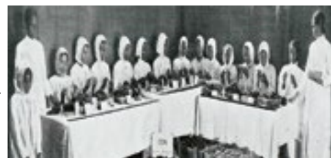
L'œuvre du cigare malgache