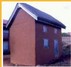
La maison des femmes artisanes betsileo