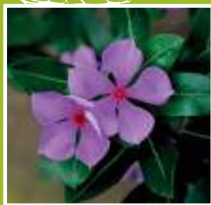
Pervenche de Madagascar